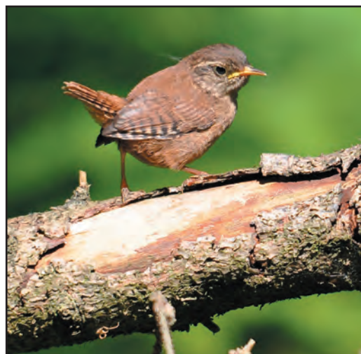
Gærdesmutten er forholdsvis sjælden i vores kolonihaver, men du kan lokke den til at tage ophold i din have med en god stor bunke kvas eller kompost.